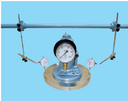
平板載荷試験機 2点計測タイプ