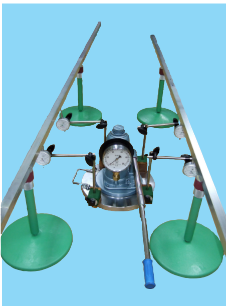
平板載荷試験機 4点計測タイプ