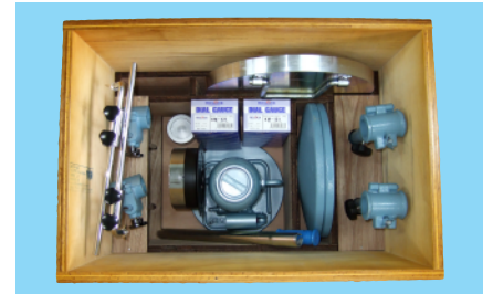
格納ケース(2点計測タイプ用)

載荷板: 直径30cm、厚さ2.5cm 1 油圧ジャッキ: 容量5t又は10t... 1 球座: ..... 1 支持台: 上下調節可能 2 支持棒: 最大3m ..... 2 ダイヤルゲージホルダー: ..... 2 ダイヤルゲージ: : 20mm ..... 2 格納箱: オプション... 1