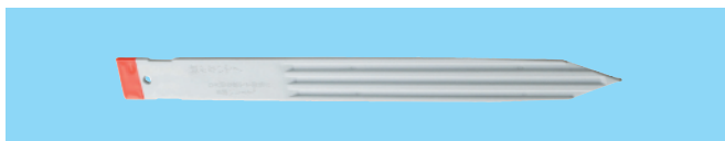
かぐや杭/仮杭(テープ付)