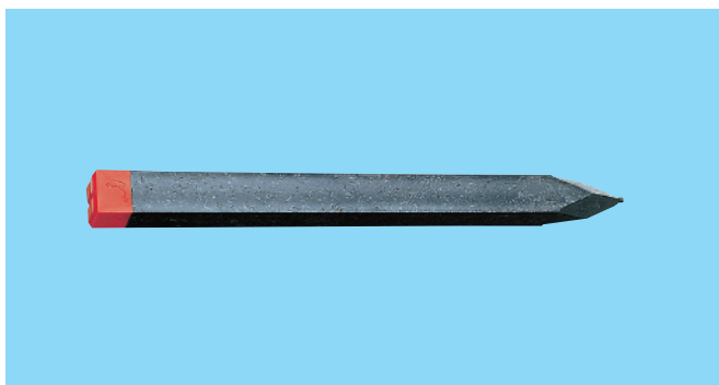
ストレート杭・高速道路杭