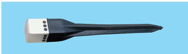
アルミキャップ杭