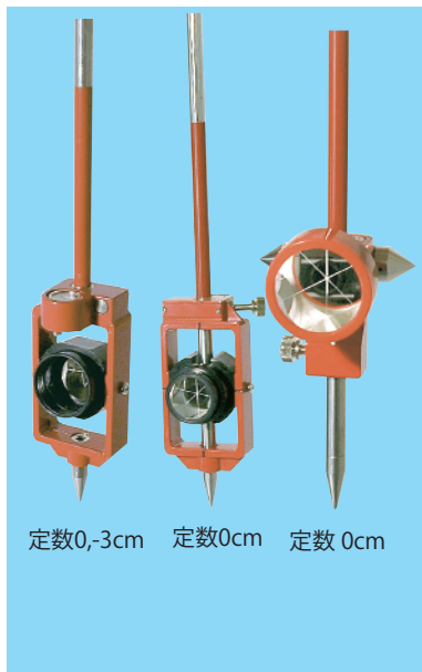
定数0,-3cm 定数0cm 定数0cm