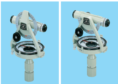
ポケットコンパス S-27