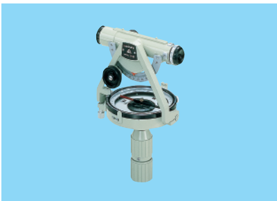
ポケットコンパス S-28