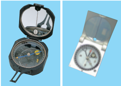
プラントンコンパス