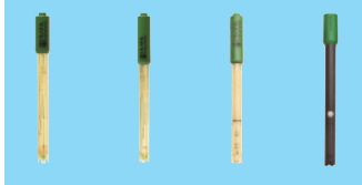
HI12300 HI12301 HI763100 HI764080