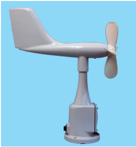
風向風速センサー