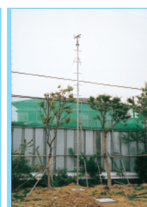
ポール ステップ・ワイヤー付